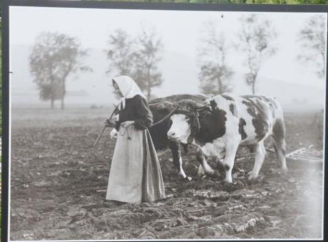
12 - La guerre finie, la femme de 1919, ne ressemble plus à celle de 1914.