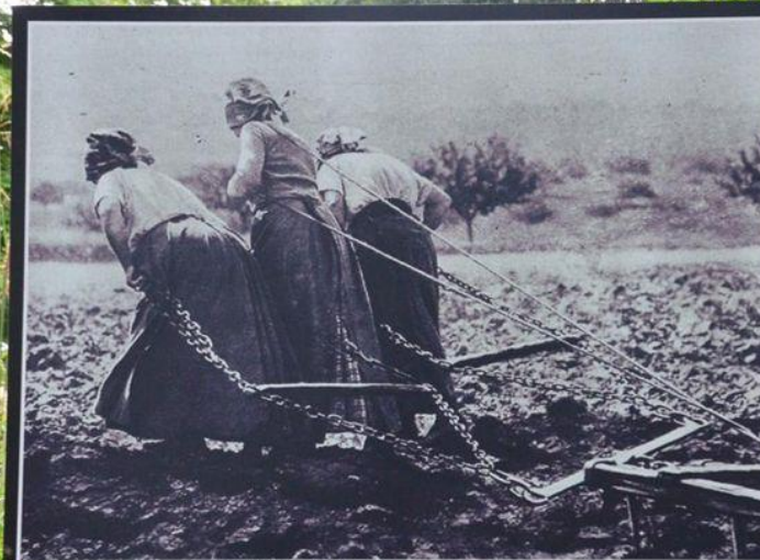
1 - Hommage aux femmes qui ont contribué à la Victoire et à la Paix.